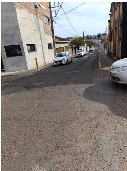
Foto 05 - Rua Seis de Abril