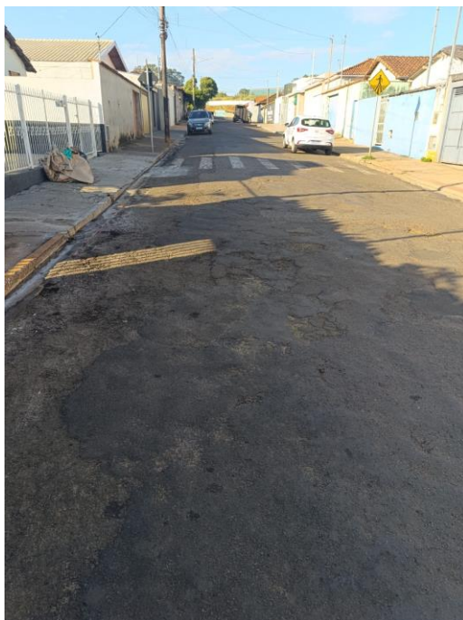
Foto 27 - Rua Sete de Setembro