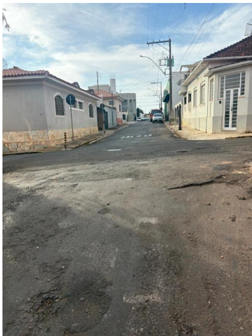
Foto 23 - Rua Sete de Setembro