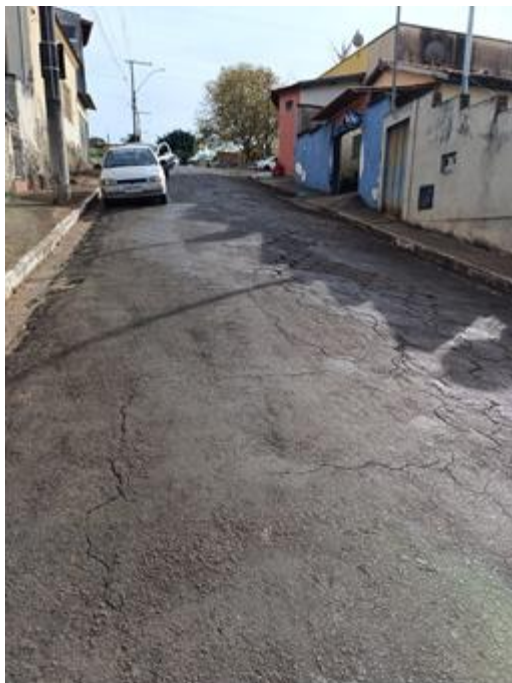
Foto 03 - Rua Seis de Abril