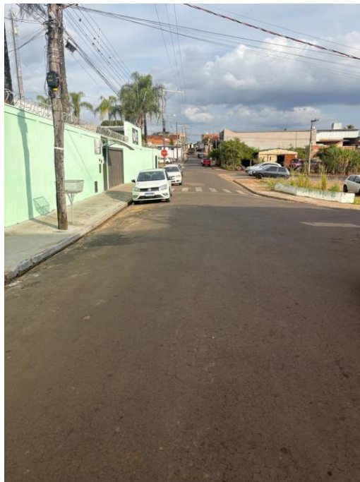
Foto 17 - Rua Sete de Setembro