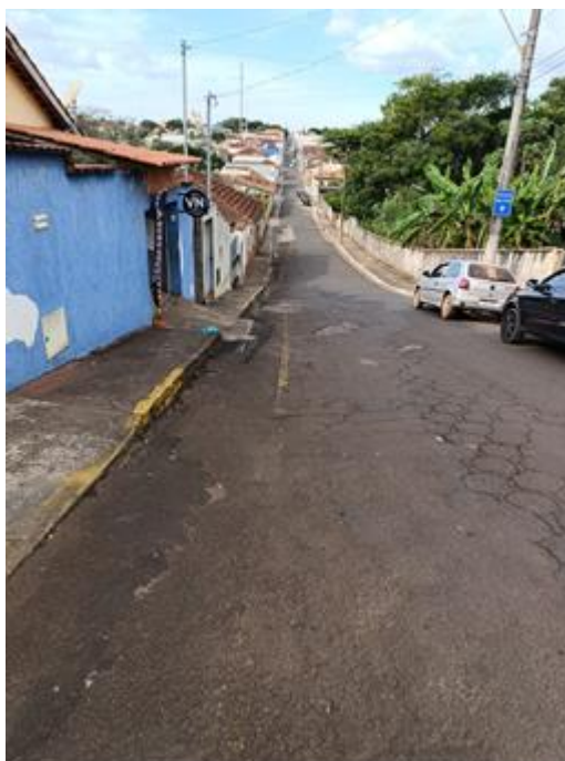
Foto 01 - Rua Seis de Abril

OBRA: “CONTRATAÇÃO DE EMPRESA ESPECIALIZADA PARA EXECUÇÃO DE OBRA DE MICRO-REVESTIMENTO ASFÁLTICO A FRIO E SINALIZAÇÃO VIÁRIA EM VIAS URBANAS DO MUNICÍPIO DE IBIRACI MG, CONTEMPLANDO A RUA 06 DE ABRIL, TRECHO DA RUA 07 DE SETEMBRO E TRECHO DA RUA 15 DE NOVEMBRO”.