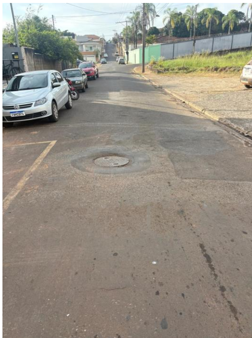
Foto 19 - Rua Sete de Setembro