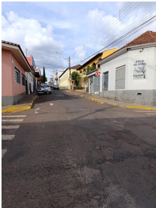
Foto 07 - Rua Seis de Abril