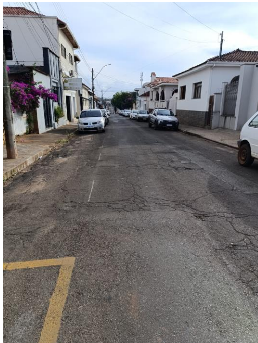
Foto 11 - Rua Quinze de Novembro