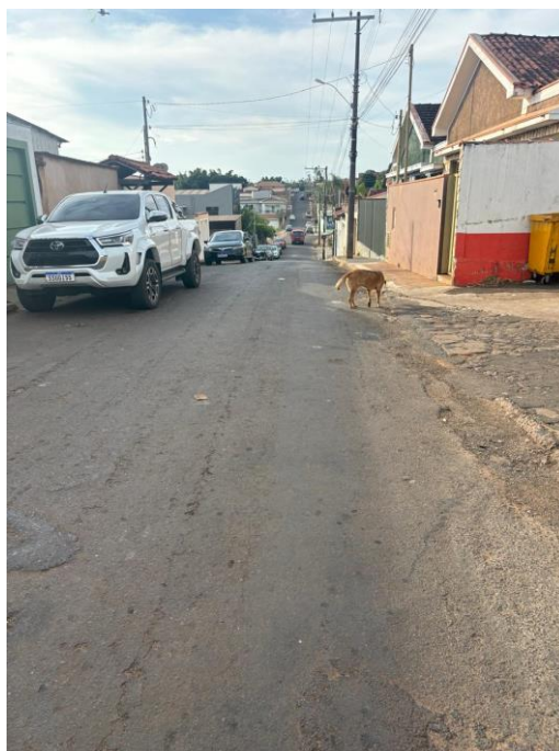
Foto 21 - Rua Sete de Setembro