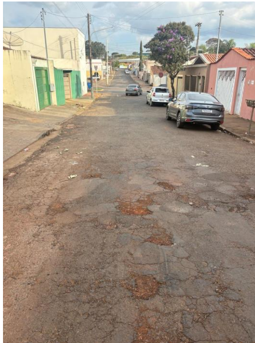
Foto 25 - Rua Sete de Setembro